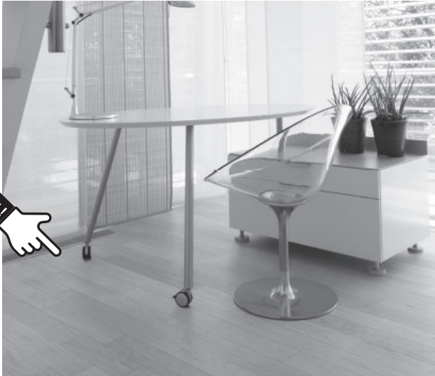
ラスティック塗装に含まれる酸化チタンに光をあてると活性酸素ができて、その酸化作用で、有害化学物質が分解されます。